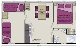
Mobil-home 4 pl Domino