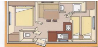
Mobil-home 4 pl + de 10 ans

Je déclare avoir pris connaissance des conditions de location au verso et déclare les accepter