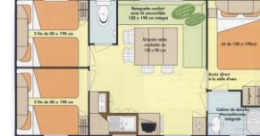
Mobil-home 3 chambres 6/8 pl

Plans non contractuels. Les croquis d'implantation intérieure des locations ne sont qu'indicatifs. Inventaire type dans les locatifs : assiettes plates, creuses, verres, tasses à café, bols, cafetière électrique, tire-bouchons, plats, saladiers, casseroles, poêles, faitout, couverts, balais, serpillière, séchoir à linge, oreillers, couvertures, protège-matelas, salon de jardin et parasol. Le mobil-home se compose : d'un séjour-salle à manger, coin cuisine aménagée (plaque de cuisson, micro-ondes, réfrigérateur, évier) avec une banquette transformable en couchage 1à2 personnes pour les mobil-home 4/6 et 6/8 places, d'une chambre avec un lit double et penderie, d'une chambre avec 2 lits simples (deux chambres avec 2 lits simples pour les modèles 6/8 places) et penderie, une salle d'eau et un WC.