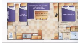
Mobil-home 4/6 pl avec terrasse