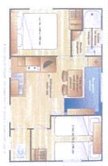
Mobil-home 4 pl avec terrasse