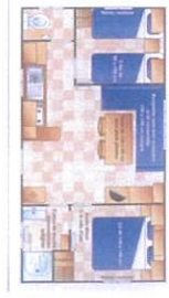
Mobil-home 4/6 pl avec terrasse