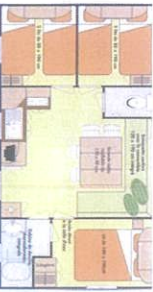
Mobil-home 3 chambres 6/7 pl